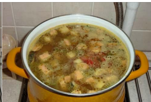
34. Кладём помидоры