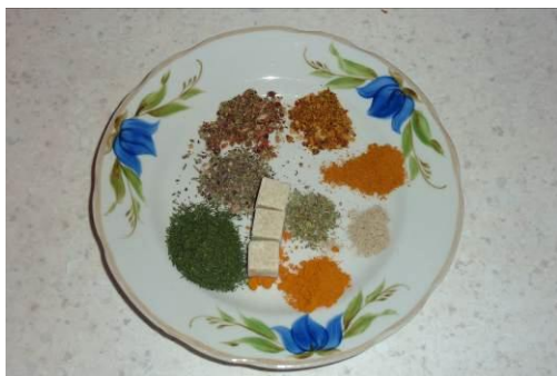
25. Отмеряем пропорции специй