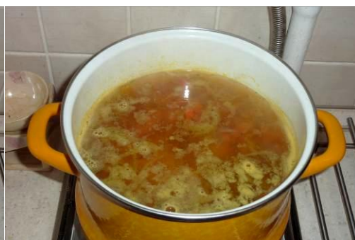
30. Кладём креветки