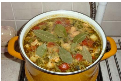
37. Кладём лист лавровый