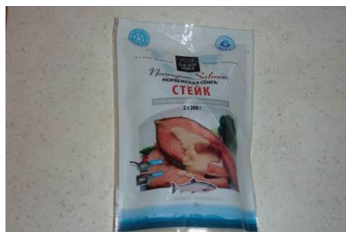
10. Берём стейк сёмги