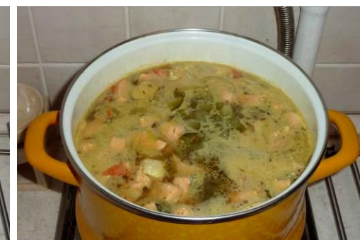
32. Кладём солёные огурцы