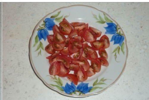
14. Режем помидоры черри мелко