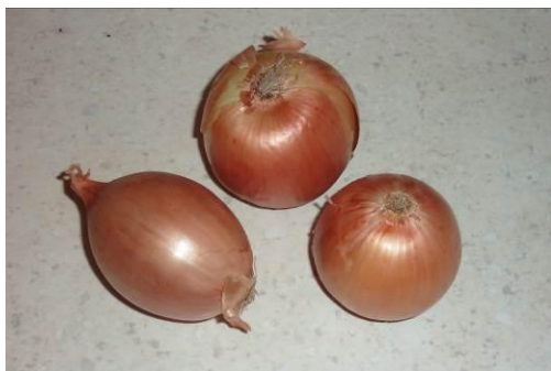
17. Берём лук репчатый