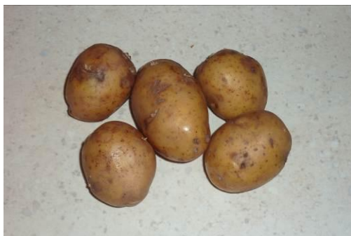
21. Берём картофель