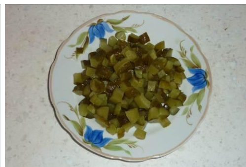
3. Режем солёные огурцы мелко