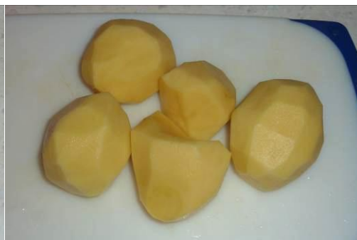
22. Чистим картофель