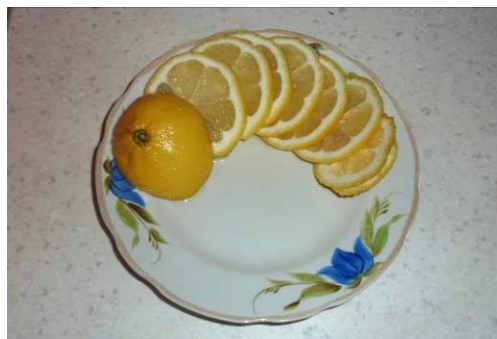
39. Режем лимон на дольки