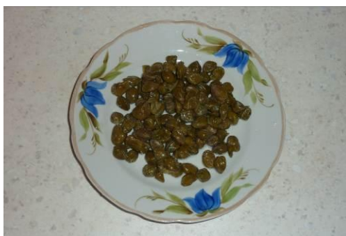
9. Готовим каперсы