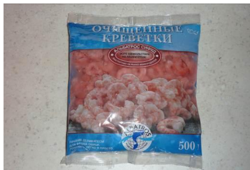
19. Берём мелкие креветки без панц.