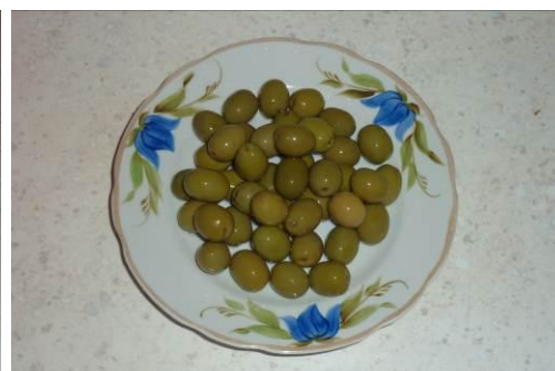
7. Готовим оливки с косточкой