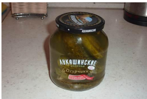
1. Берём солёные огурцы