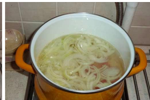
27. Кладём лук и морковь