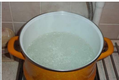
26. Кипятим воду