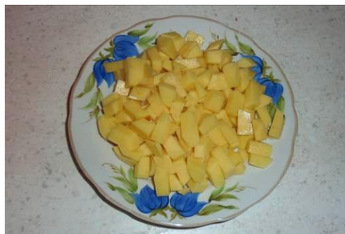
23. Режем картофель мелко