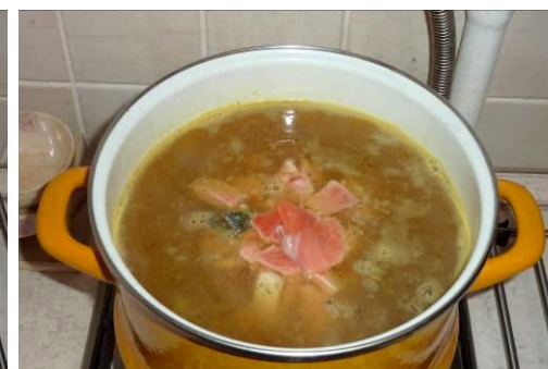
31. Кладём сёмгу