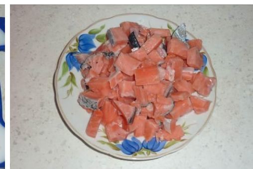
12. Режем сёмгу мелко