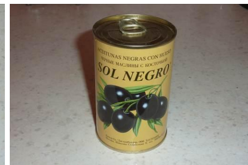
4. Берём маслины с косточкой