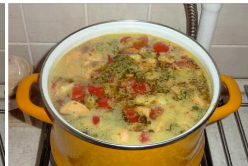
35. Проверяем на соль