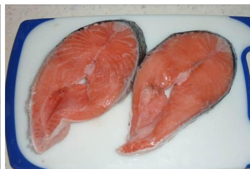
11. Размораживаем стейк сёмги