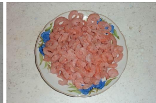
20. Готовим мелкие креветки без панц.