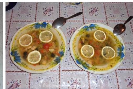
40. Солянка украшается дольками лимона