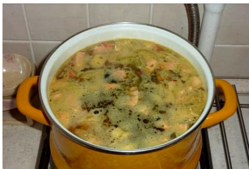
33. Кладём маслины, оливки и каперсы