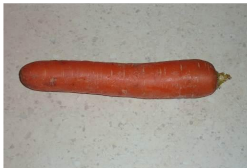
15. Берём морковь