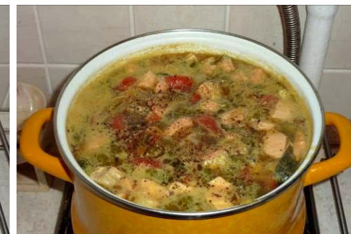
36. Проверяем на специи