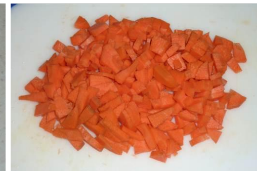
16. Режем морковь мелко