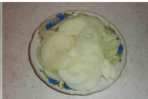
18. Режем лук мелкими полукольцами