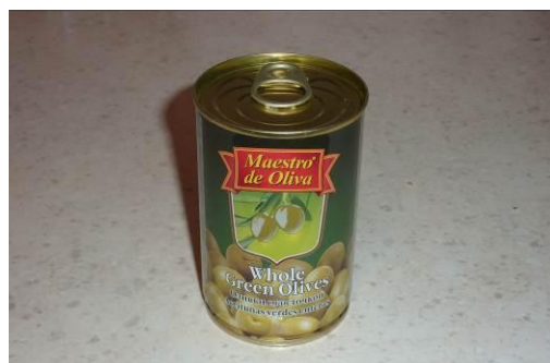
6. Берём оливки с косточкой