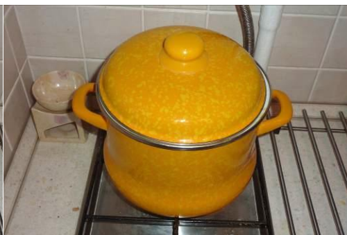
38. Томление под крышкой без огня