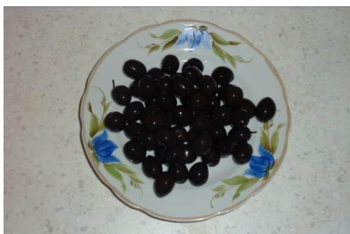
5. Готовим маслины с косточкой