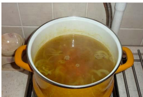
29. Кладём картофель