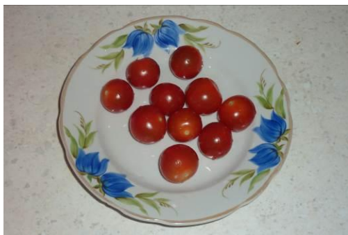
13. Берём помидоры черри