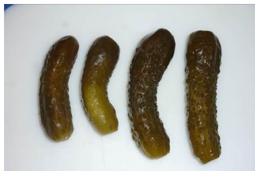
2. Готовим солёные огурцы