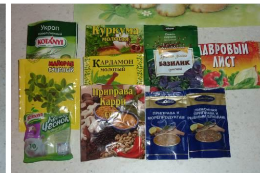
24. Берём специи