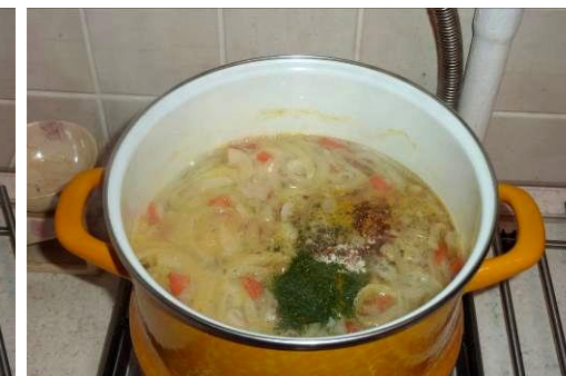
28. Кладём специи