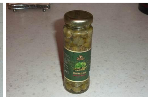
8. Берём каперсы