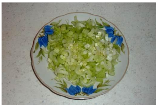
21. Режем стебель сельдерея мелко