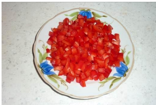
11. Режем перец красный сладкий мелко