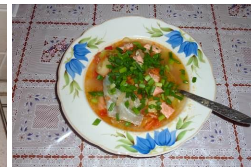
40. Уха готова, подаётся с мелко нарезанным зелёным луком