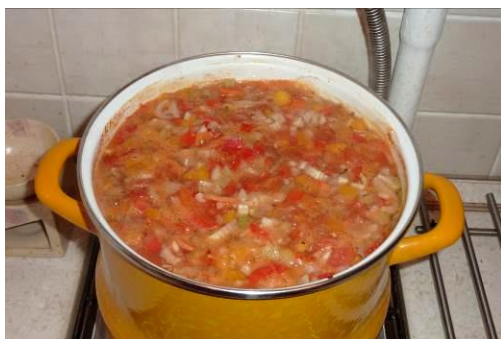
37. Кладём форель в кастрюлю