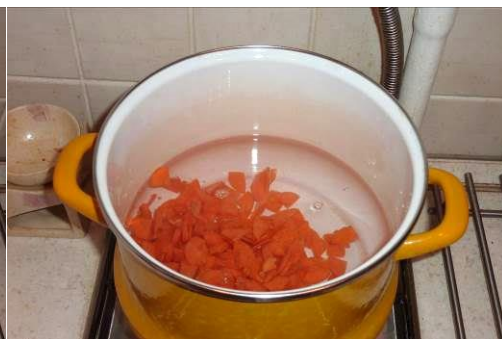
26. Кладём морковь в кастрюлю