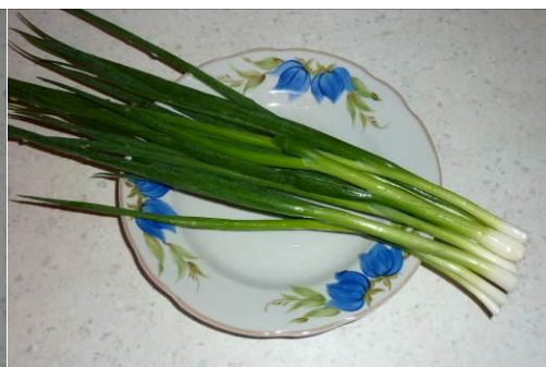
22. Берём зелёный лук