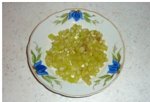
15. Режем перец зелёный мелко