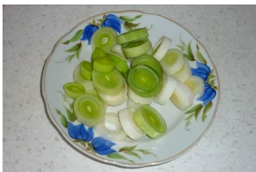
17. Режем лук-порей колечками