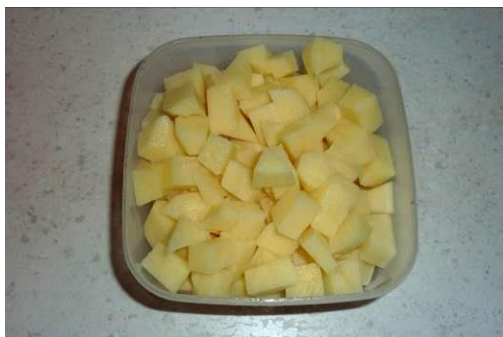
5. Режем картофель мелко