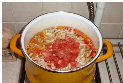
31. Кладём помидоры в кастрюлю