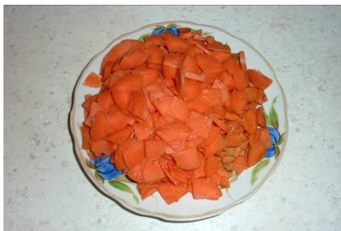
7. Режем морковь мелко