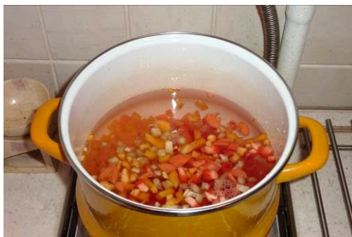
29. Кладём перец зелёный в кастрюлю