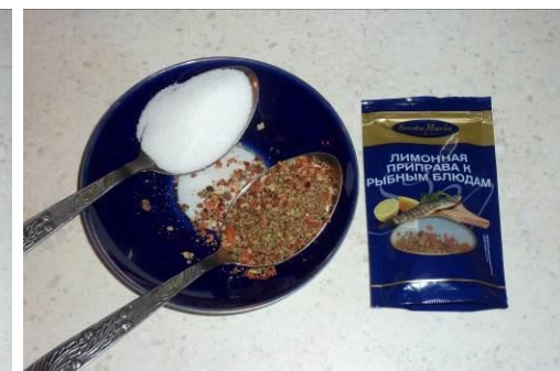
24. Берём соль и лимонную приправу к рыбным блюдам