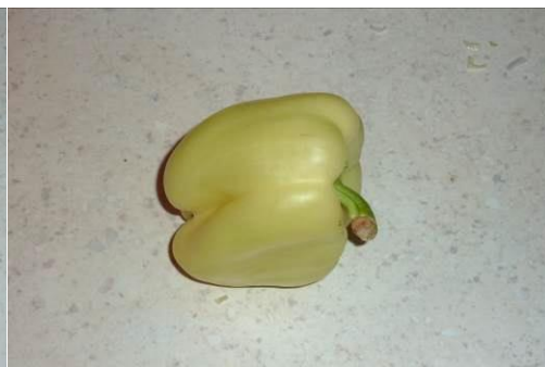
14. Берём перец зелёный