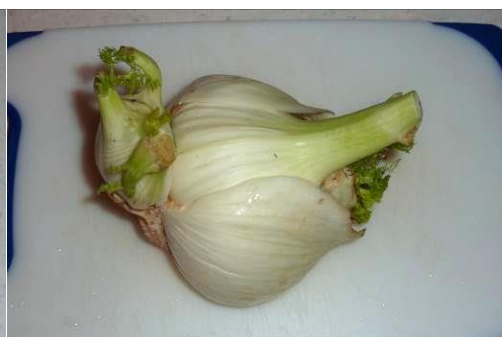
18. Берём корень фенхеля