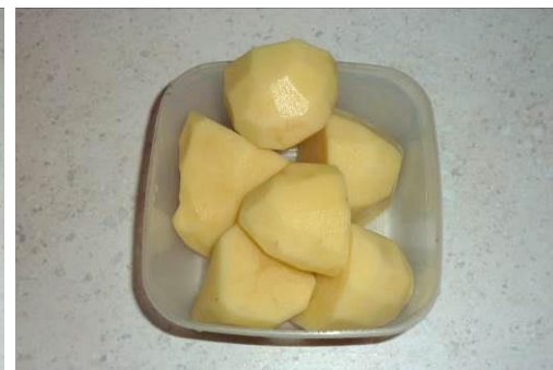
4. Чистим картофель