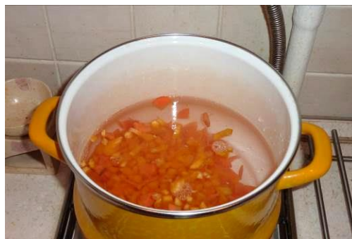
27. Кладём перец жёлтый сладкий в кастрюлю