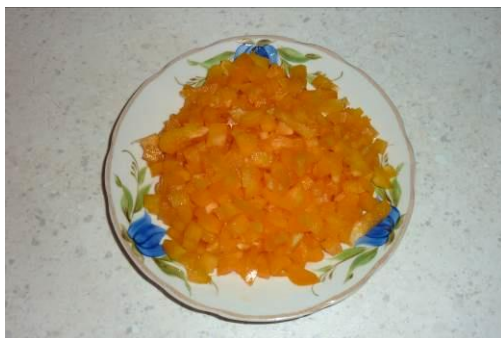
13. Режем перец жёлтый сладкий мелко