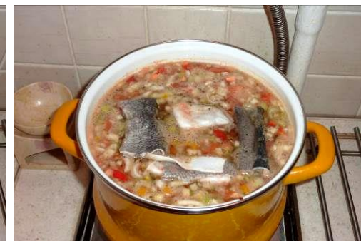
36. Кладём кожу форели в кастрюлю