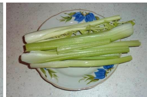
20. Берём стебель сельдерея