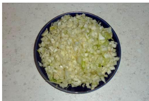
19. Режем корень фенхеля мелко