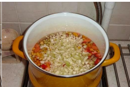
30. Кладём корень фенхеля в кастрюлю