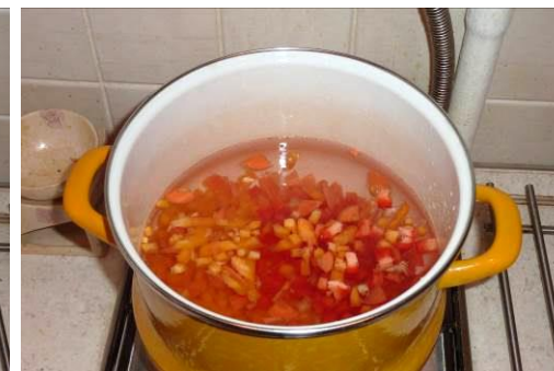
28. Кладём перец красный сладкий в кастрюлю