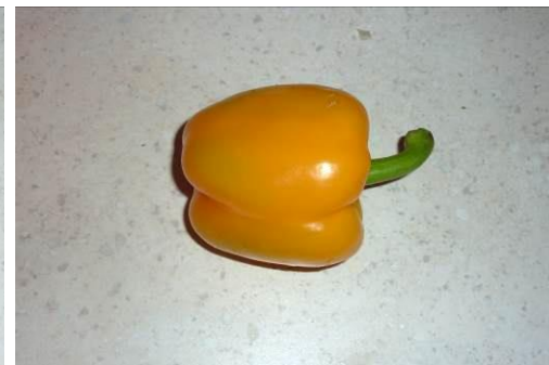
12. Берём перец жёлтый сладкий