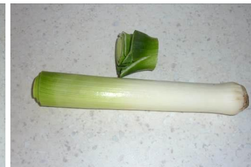
16. Берём лук-порей