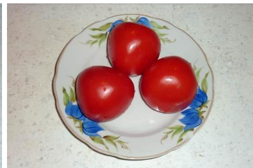
8. Берём помидоры