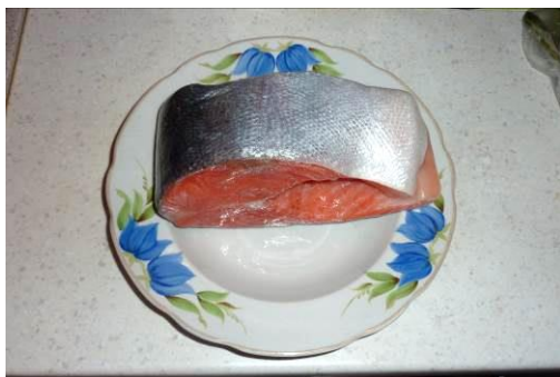
1. Берём стейк форели