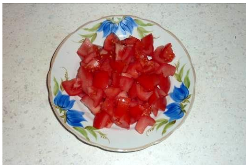
9. Режем помидоры мелко