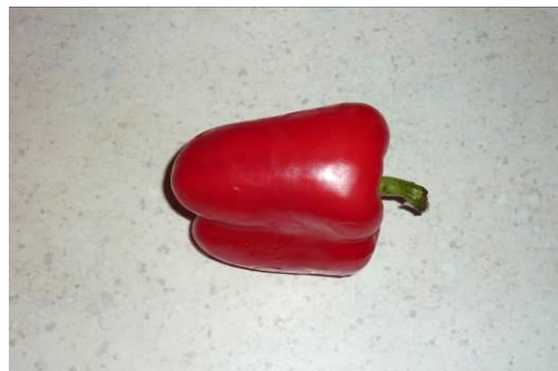
10. Берём перец красный сладкий