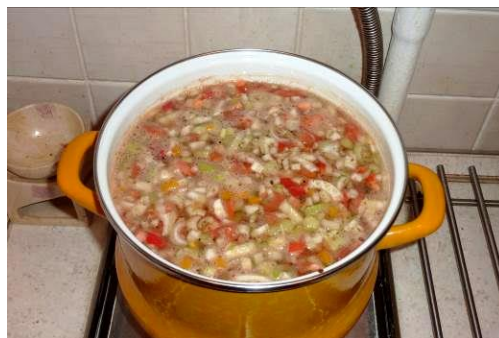
35. Перемешиваем содержимое кастрюли и варим на малом огне