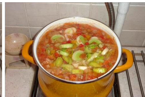
39. Варим уху до готовности на малом огне