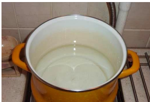
25. Греем воду