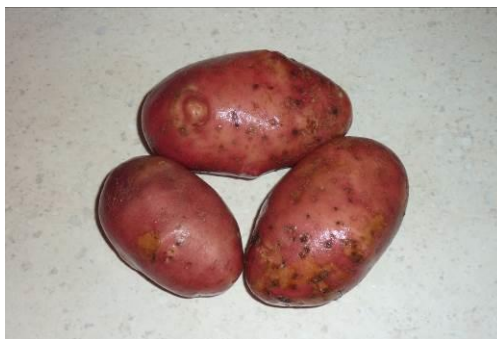
3. Берём картофель