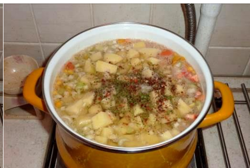
34. Кладём соль и лимонную приправу к рыбным блюдам в кастрюлю