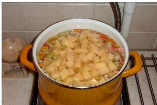
33. Кладём картофель в кастрюлю