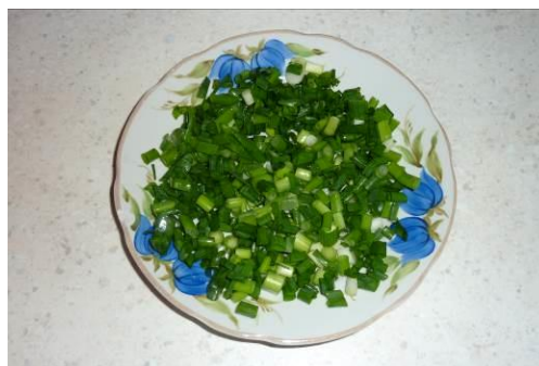
23. Режем зелёный лук мелко