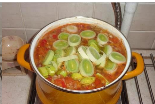
38. Кладём лук порей в кастрюлю