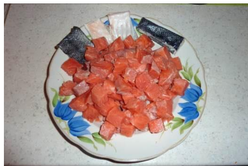
2. Разделяет стек форели на мелкие порции и удаляем кости и кожу