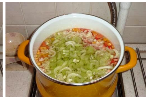
32. Кладём стебель сельдерея в кастрюлю