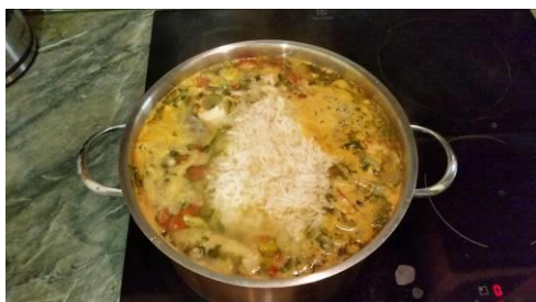
29. Кладём отварной рис в кастрюлю