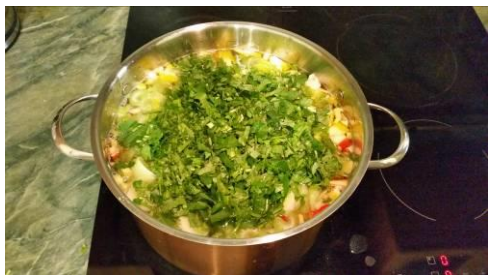
25. Кладём зелень кинзы в кастрюлю