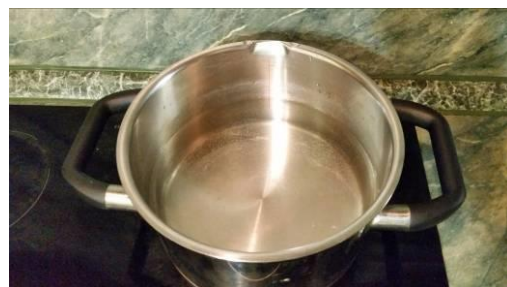
22. Ставим кастрюлю с водой на огонь