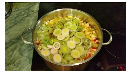
36. Кладём лук-порей в кастрюлю