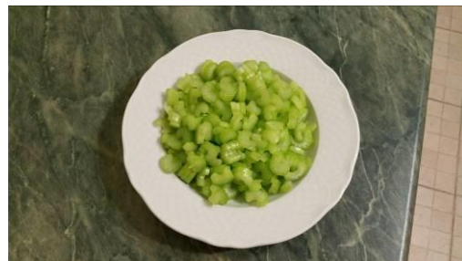
14. Режем стебель сельдерея тонкими пластинками