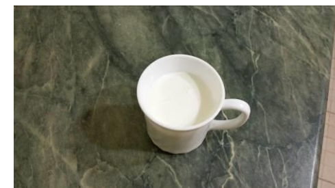
32. Отмеряем вторую порцию молока