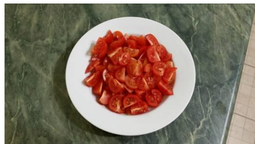
10. Режем помидоры на четвертинки