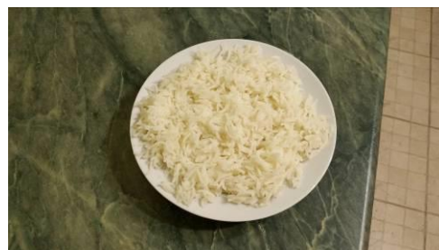
30. Выкладываем рис на отдельную тарелку