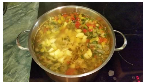
27. Кладём картофель в кастрюлю