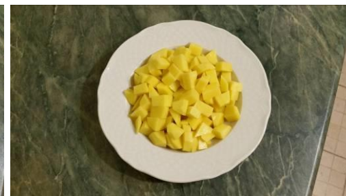
8. Режем картофель мелкими кусочками