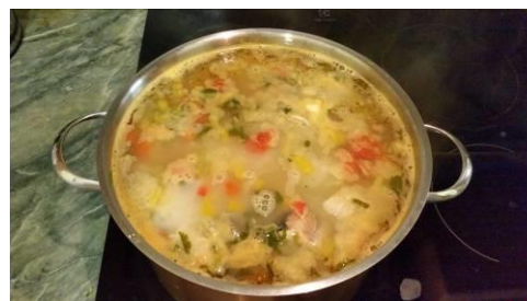
31. Вливаем первую порцию молока в кастрюлю, варим на малом огне