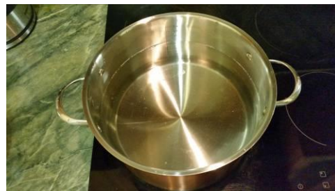
27. Ставим кастрюлю с водой на огонь