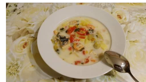
36. Подаём уху на стол