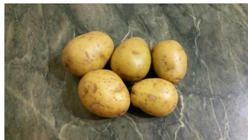
6. Берём картофель