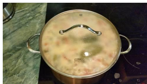
35. Накрываем кастрюлю крышкой и томим без огня