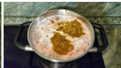
24. Кладём соль и приправу для морепродуктов в кастрюлю