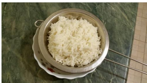
29. Отфильтровываем рис