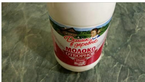
21. Берём молоко жирностью 3,5-4,5%