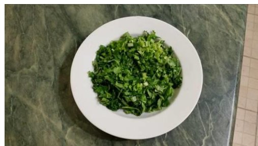
18. Режем зелень кинзы мелко