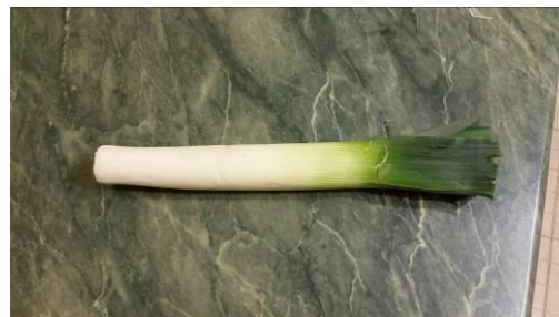
15. Берём лук-порей