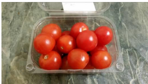
9. Берём помидоры "Черри"