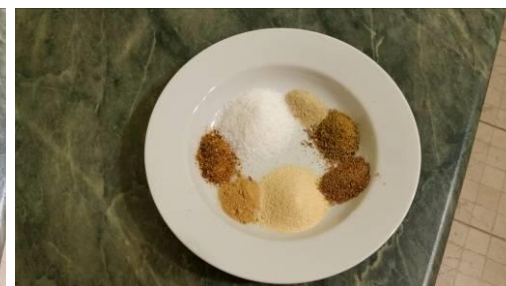
20. Составляем пропорции специй