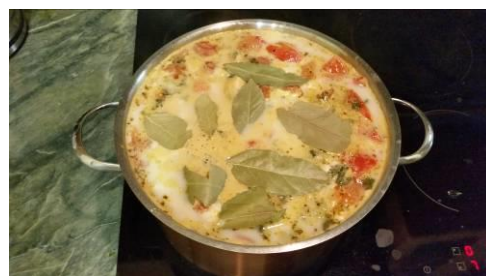
34. Кладём лист лавровый в кастрюлю