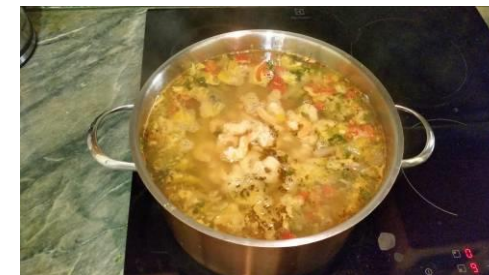
28. Кладём отварные креветки в кастрюлю