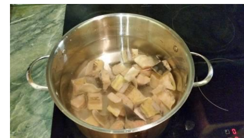
32. Кладём порционного осетра в кастрюлю