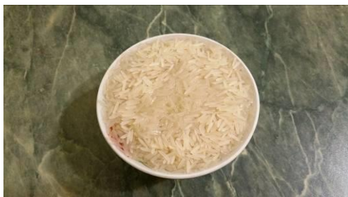
5. Замачиваем рис в воде