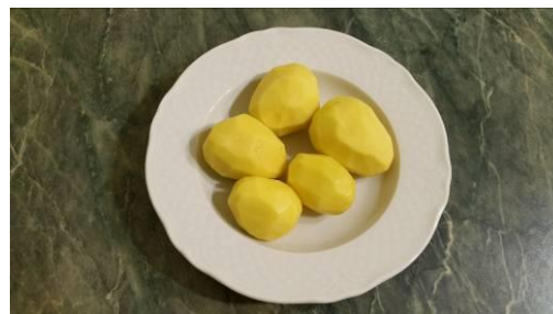
7. Чистим картофель