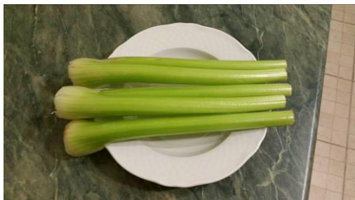
13. берём стебель сельдерея