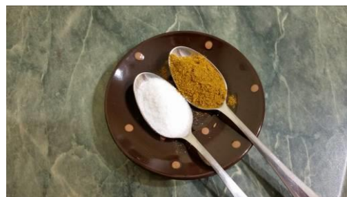
19. Берём соль и приправу для морепродуктов