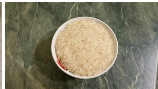
4. Отмеряем рис