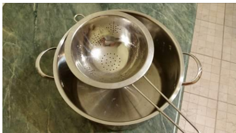
25. Отфильтровываем креветки