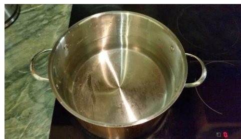
31. Ставим кастрюлю с водой на огонь