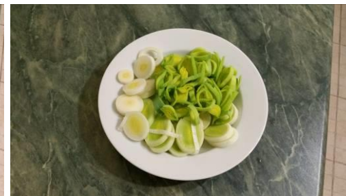
16. Режем лук-порей тонкими кольцами