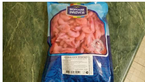
2. Берём креветки "Королевские" с панцирями