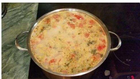
33. Вливаем вторую порцию молока в кастрюлю, доводим до кипения