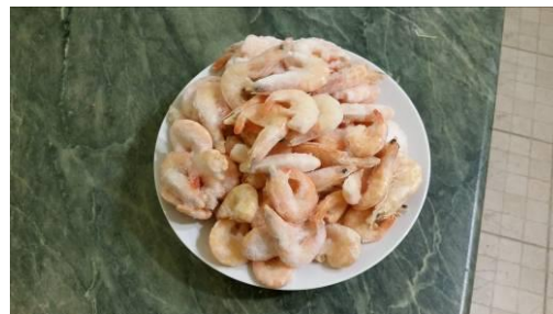
3. Размораживаем креветки