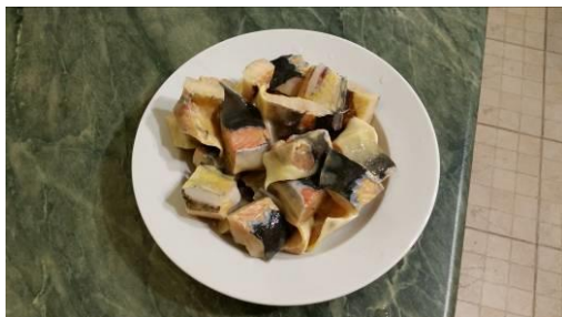
1. Разделяем осетра порционно