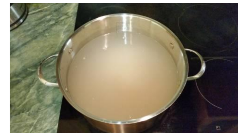
28. Кладём рис в кастрюлю и варим