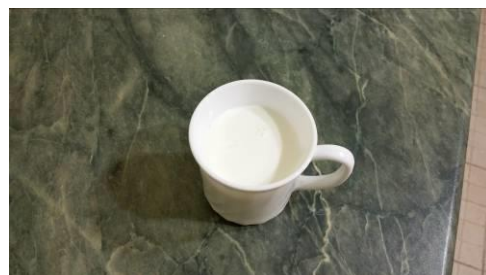
30. Отмеряем первую порцию молока