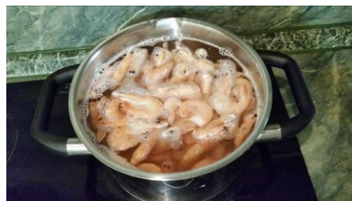
23. Кладём креветки в кастрюлю