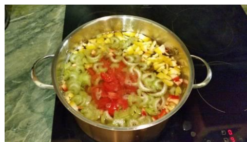
35. Кладём помидоры в кастрюлю