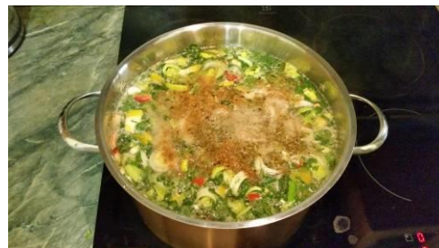
26. Кладём специи в кастрюлю