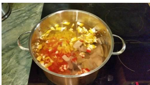
33. Кладём перцы сладкие в кастрюлю