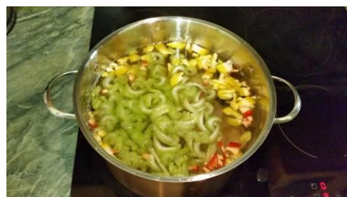
34. Кладём стебель сельдерея в кастрюлю