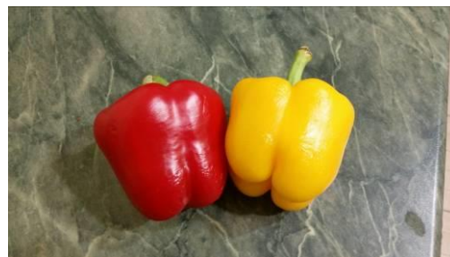
11. Берём перцы сладкие