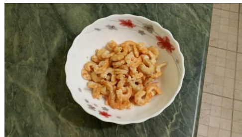
26. Очищаем креветки от панцирей