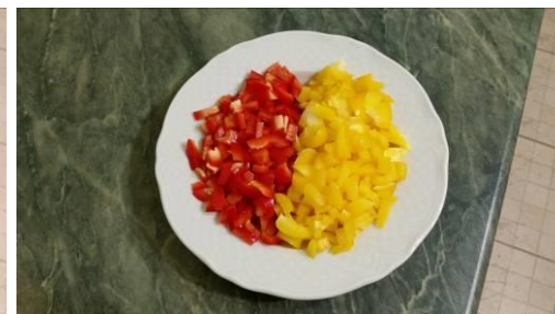
12. Режем перцы сладкие мелкими кусочками