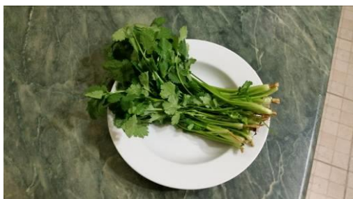
17. Берём зелень кинзы