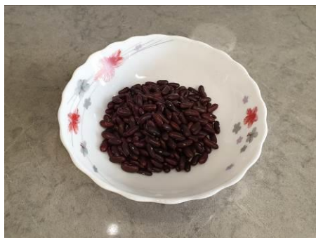
9. Берём фасоль красную