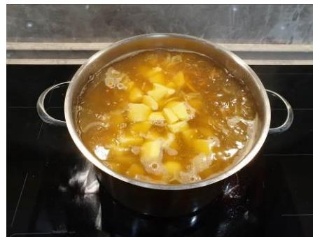
31. Кладём картофель в кастрюлю варим на среднем огне