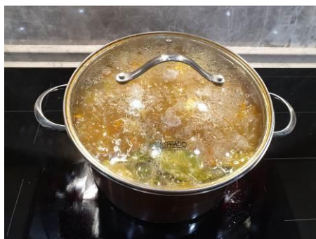
33. Накрываем кастрюлю крышкой и варим на малом огне