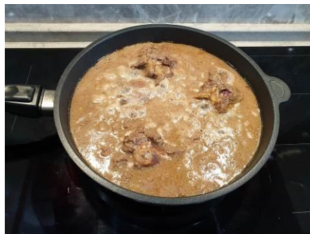
19. Заливаем мясо в сковороде горячей водой