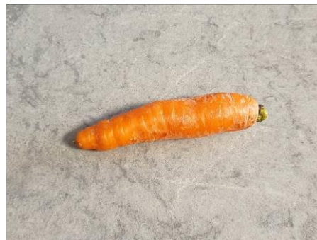
7. Берём морковь