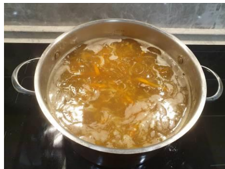
30. Варим, удаляем накипь