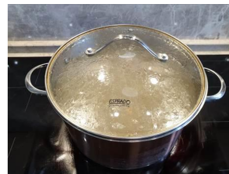
24. Накрываем кастрюлю крышкой и варим на малом огне