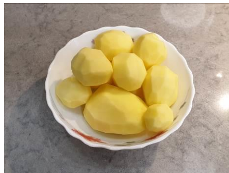
2. Берём картофель