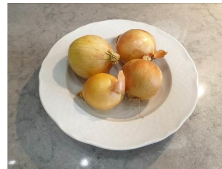
4. Берём лук репчатый