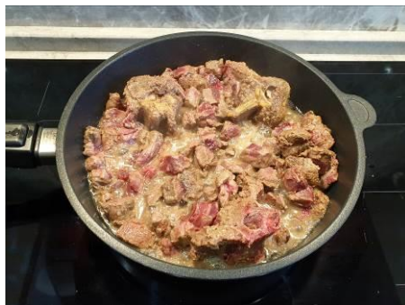
18. Периодически переворачиваем куски мяса медведя