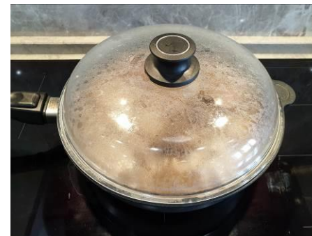
20. Накрываем сковороду крышкой и тушим на среднем огне