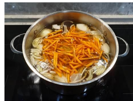
28. Кладём лук репчатый и морковь в кастрюлю