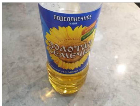
13. Берём масло растительное