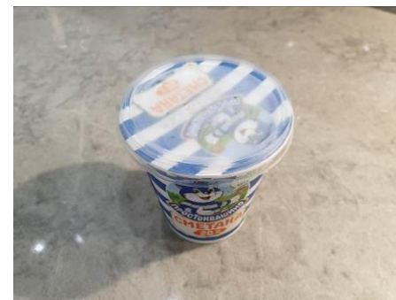
12. Берём сметану жирностью 20 %