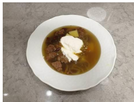
35. Добавляем сметану