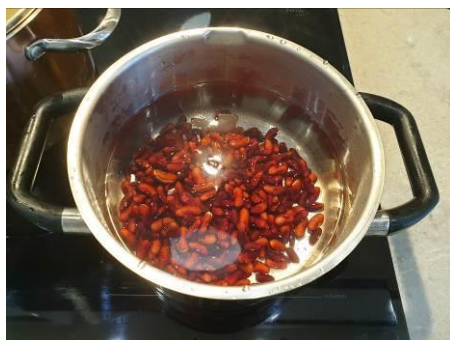
14. Варим фасоль в подсоленной воде