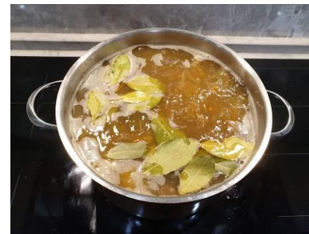
32. Кладём лист лавровый в кастрюлю