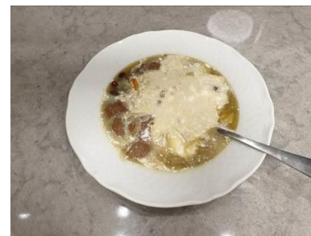
36. Размешиваем сметану