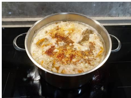
29. Удаляем накипь, кладём специи, варим на среднем огне