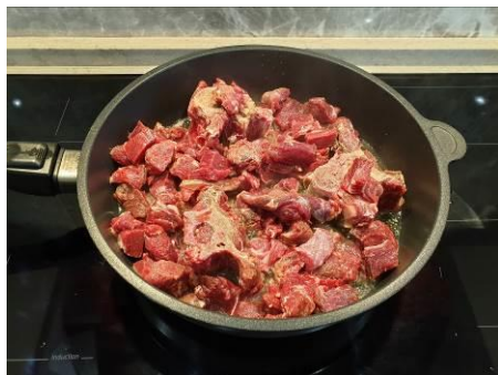
17. Кладём мясо медведя в сковороду, жарим в кипящем масле