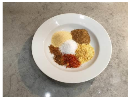
11. Отмеряем пропорции специй