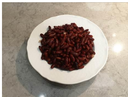
15. Отваренную фасоль выкладываем на тарелку