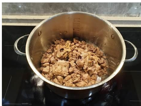
25. Мясо медведя промываем и снова кладём в кастрюлю