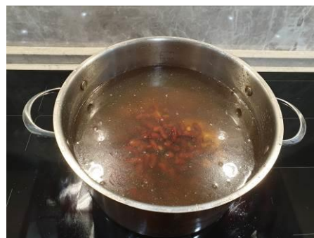
27. Кладём фасоль красную в кастрюлю