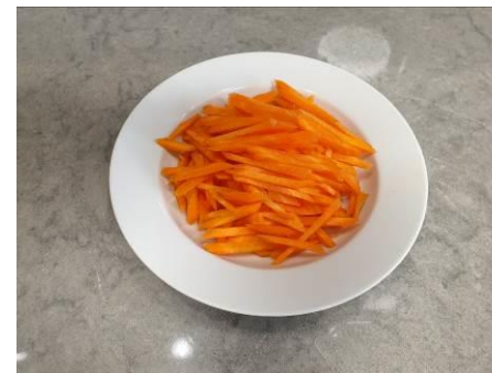
8. Режем морковь тонкой соломкой