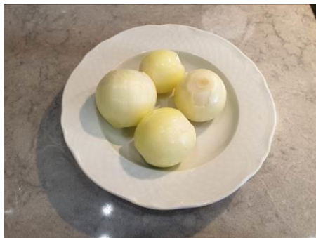
5. Чистим лук репчатый