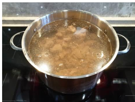
23. Кладём обжаренное мясо медведя в кастрюлю