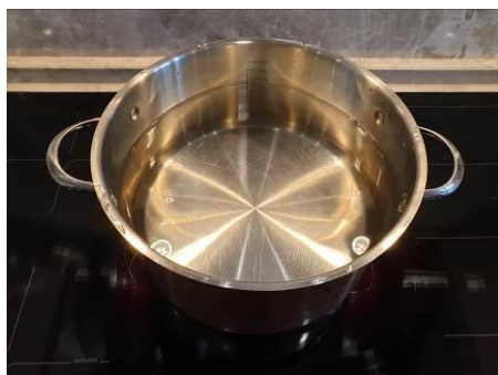
22. Ставим кастрюлю с водой на огонь