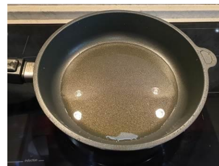
16. Ставим сковороду с маслом растительным на огонь