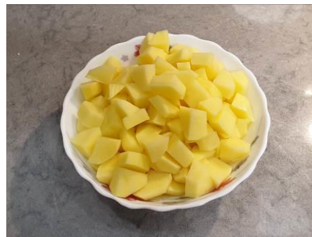
3. Чистим и режем картофель средними кусочками