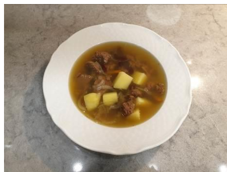
34. Подаём суп на стол