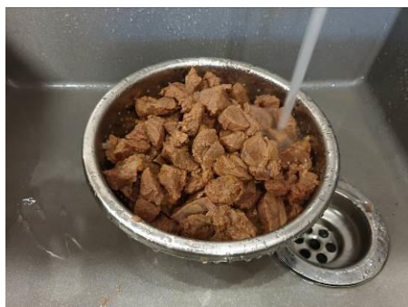
21. Обжаренное мясо промываем холодной водой