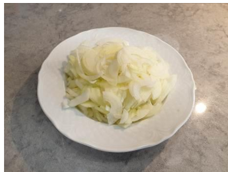
6. Режем лук репчатый тонкой соломкой