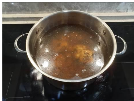
26. Наливаем воду в кастрюлю и ставим на огонь