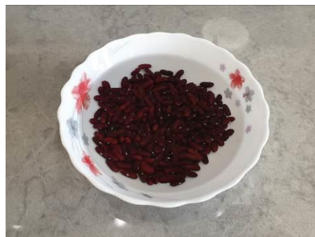
10. Замачиваем в воде фасоль красную