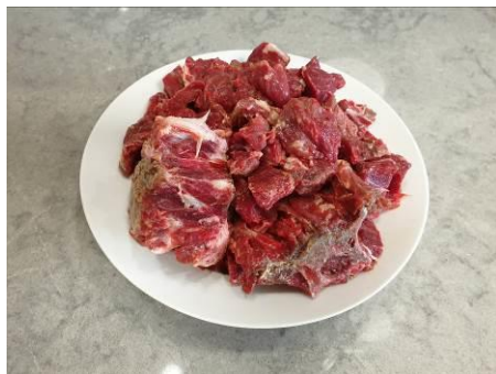
1. Берём мясо медведя на хребте