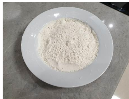
7. Перемешиваем специи и муку