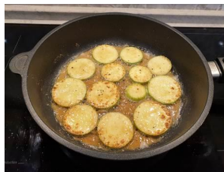
11. Обжариваем кабачки с двух сторон на большом огне