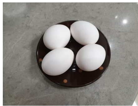
3. Берём яйца куриные