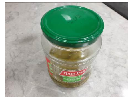
4. Берём корнишоны маринованные