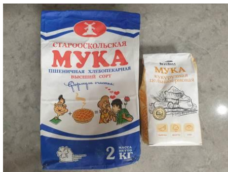
5. Берём муку кукурузную и пшеничную