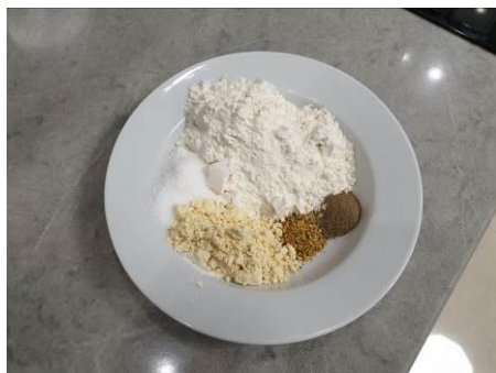
6. Отмеряем специи, муку кукурузную и пшеничную