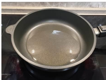
10. Ставим сковороду с маслом на огонь, доводим масло до кипения