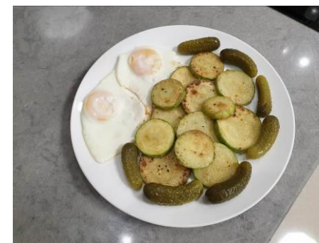
12. Обжаренные яйца и кабачки с корнишонами кладем на тарелку