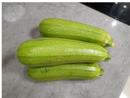
1. Берём кабачки