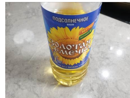
8. Берём масло растительное