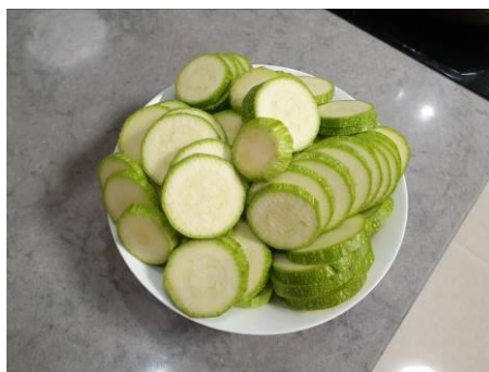
2. Режем кабачки тонкими дисками