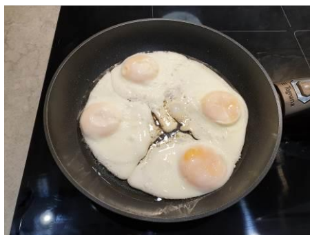
Жарим яйца на растительном масле под крышкой на малом огне