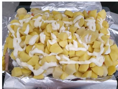
18. Вторую часть майонеза кладём поверх картофеля