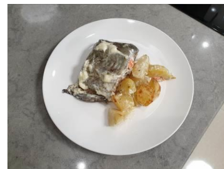
24. Подаём на стол