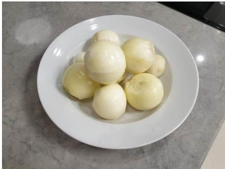
5. Чистим лук репчатый