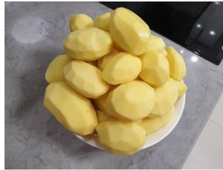
3. Чистим картофель