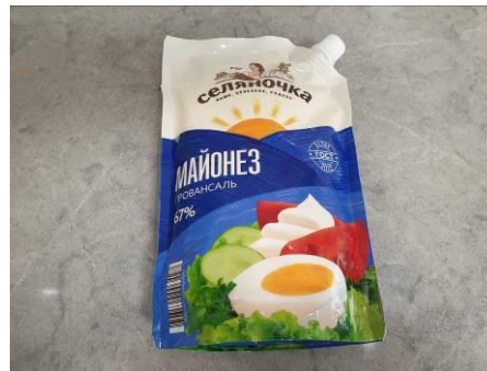
11. Берём майонез