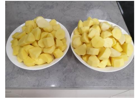
4. Режем картофель крупно