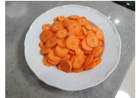
8. Режем морковь тонкими пластинками