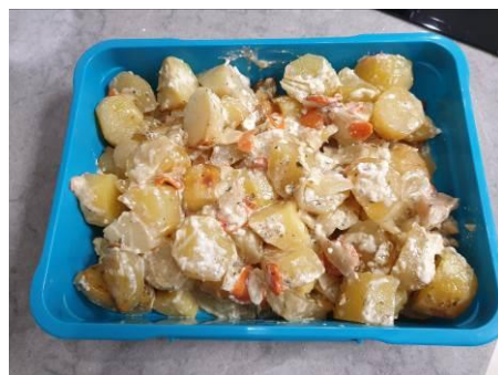
22. Картофель укладываем с контейнер для хранения