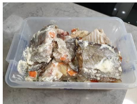
23. Мясо сома укладываем в контейнер для хранения