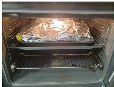
19. Закрываем фольгу и ставим в духовку. Запекаем при 250-180°C