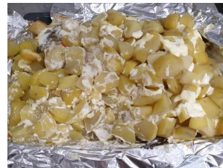
20. Вскрываем фольгу сверху и запекаем при 180°C