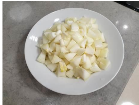
6. Режем лук репчатый крупно