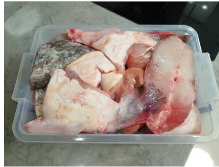
2. Разделяем сома на крупные части