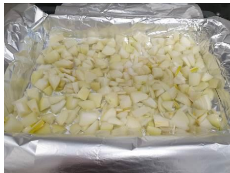
14. Кладём лук репчатый на противень