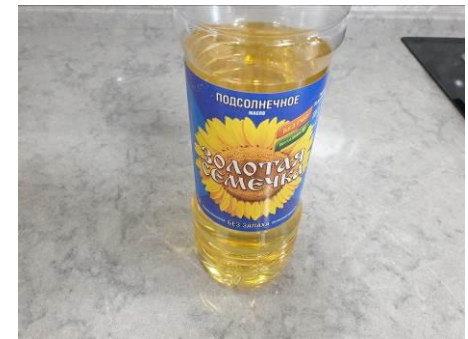
12. Берём масло растительное