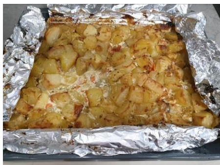
21. Извлекаем противень из духовки