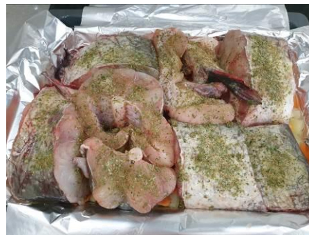
15. Мясо сома покрываем специями, кладём на противень