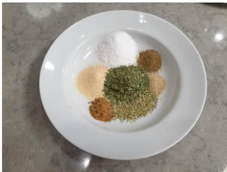
9. Составляем пропорции специй