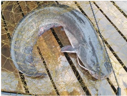
1. Ловим сома