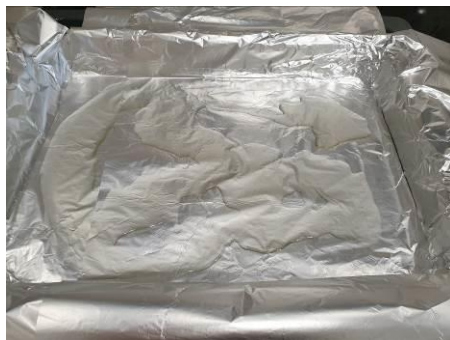
13. Противень покрываем фольгой, наливаем масло растительное