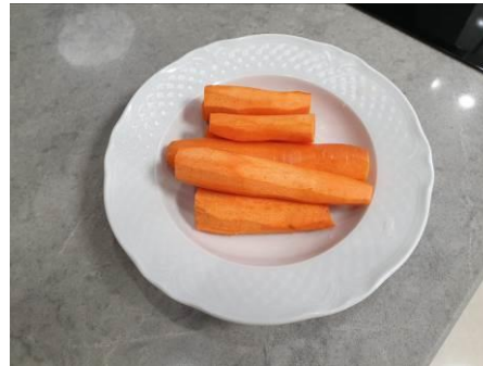
7. Чистим морковь