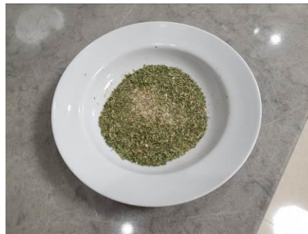
10. Перемешиваем специи