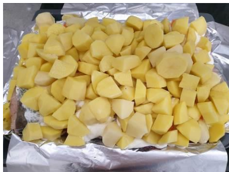
17. Кладём картофель на противень, посыпаем солью и перцем чёрным