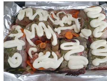
16. Морковь и часть майонеза кладём поверх мяса сома