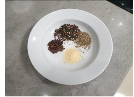
4. Составляем пропорции специй