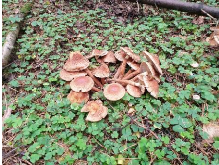
1. Собираем опята королевские