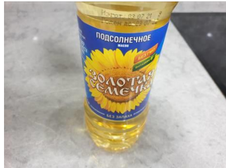
6. Берём масло растительное