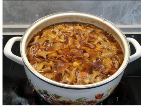
2. Варим опята королевские 3 раза меняя воду