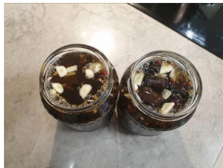
10. Наливаем в банки отвар от грибов