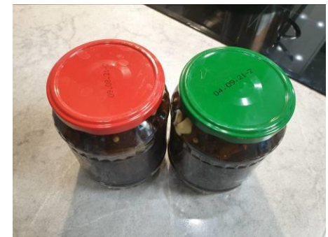
12. Закрываем банки герметично, даём остыть, ставим в холодильник