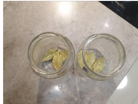
7. Стерилизуем банки, кладём на дно лист лавровый