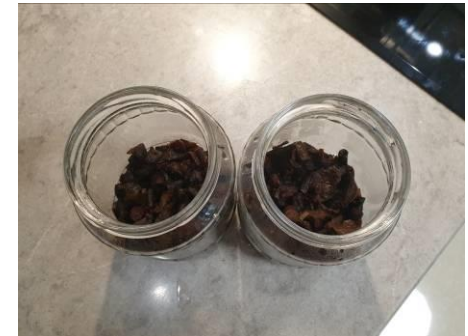
8. Послойно укладываем отварные опята королевские в банки