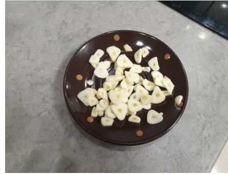
3. Чистим и режем чеснок тонкими пластинками