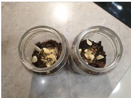
9. Между слоями опята королевские укладываем чеснок и