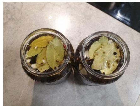
11. Кладём лист лавровый и наливаем слой масла в банки