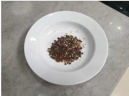
5. Перемешиваем специи