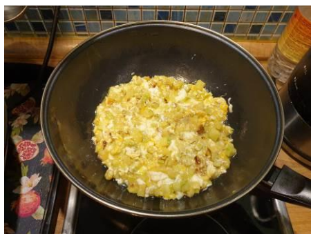
10. Перемешиваем, жарим на большом огне до загустевания