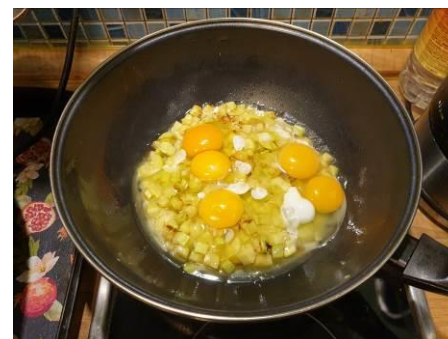
8. Выбиваем яйца куриные в вок