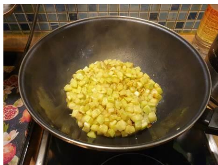
7. Перемешиваем, жарим на большом огне, подрумяниваем