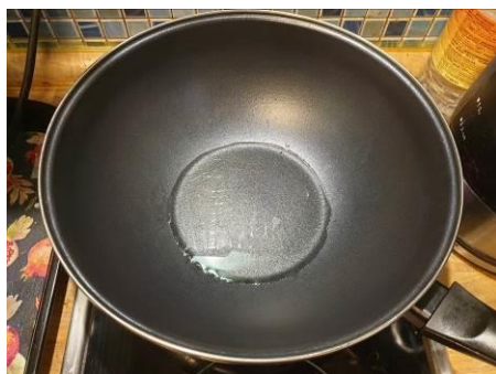
5. Ставим вок с малом растительным на огонь