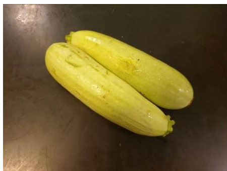
1. Берём кабачки