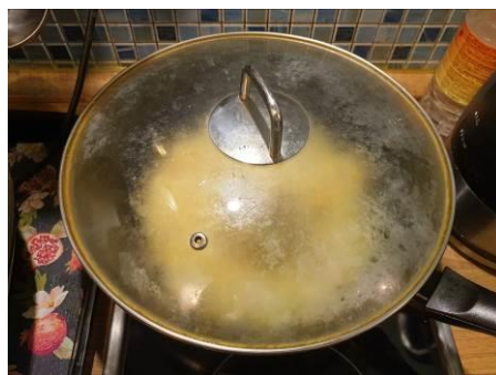
11. Накрываем вок крышкой и томим на малом огне