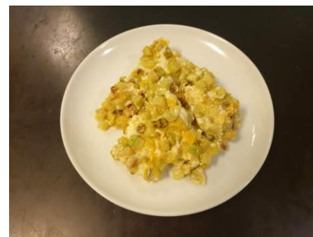
12. Подаём на стол