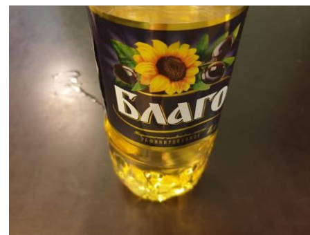
4. Берём масло растительное