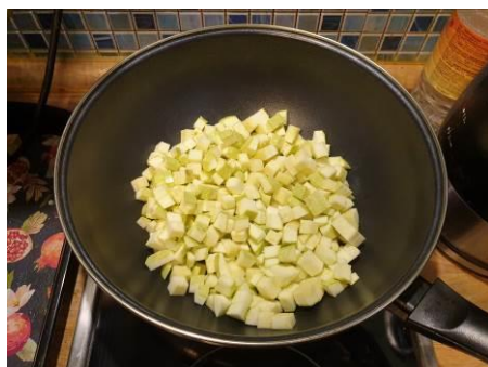
6. Кладём кабачки в вок