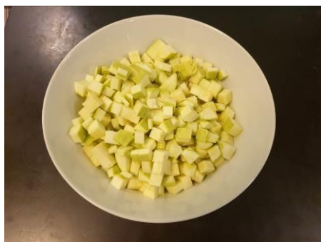
2. Режем кабачки мелкими кубиками