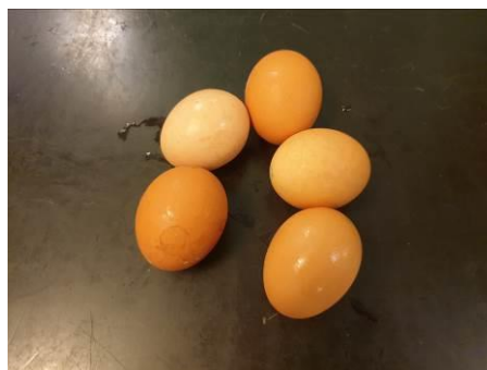
3. Берём яйца куриные