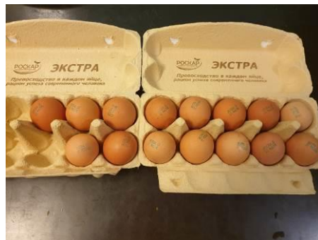
2. Берём яйца куриные