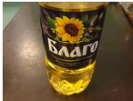
3. Берём масло растительное