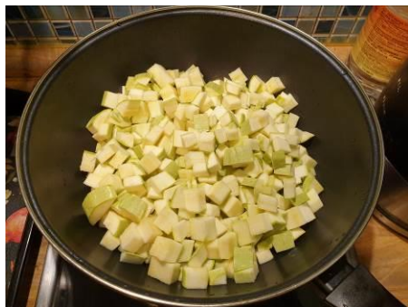
5. Кладём кабачки в вок