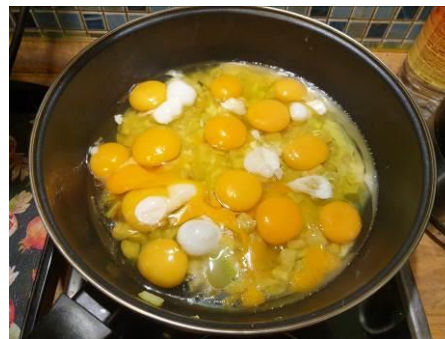
7. Выбиваем яйца куриные в вок