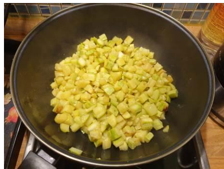
6. Перемешиваем, жарим на большом огне, подрумяниваем