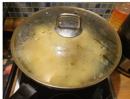
11. Накрываем вок крышкой и томим на малом огне