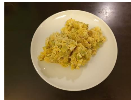
12. Подаём на стол