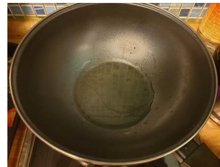
4. Ставим вок с маслом растительным на огонь