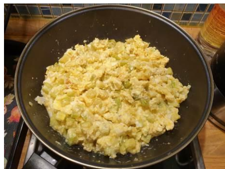
10. Жарим на большом огне до загустевания