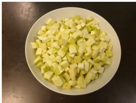
1. Режем кабачки мелкими кубиками