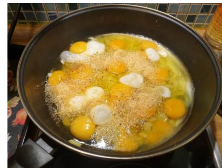
8. Кладём специи в вок