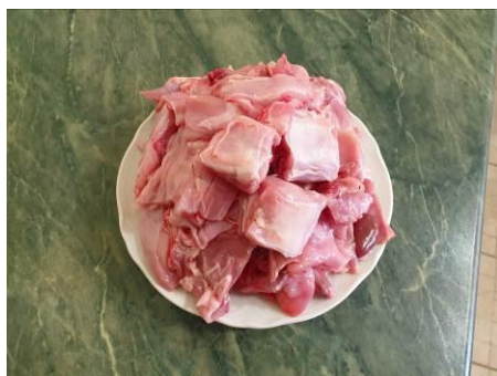
1. Берём мясо кролика