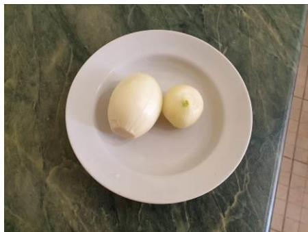
6. Чистим лук репчатый