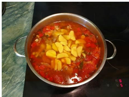
29. Кладём картофель в кастрюлю