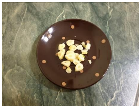
11. Чистим и режем чеснок тонкими пластинками