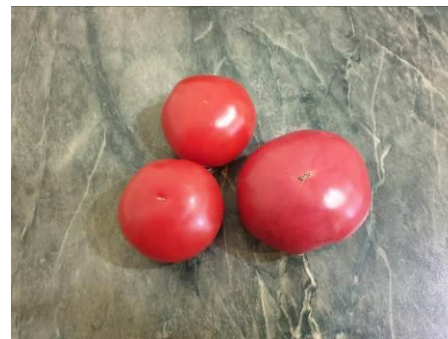
8. Берём помидоры