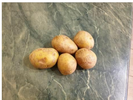
2. Берём картофель