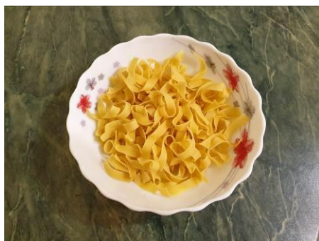
13. Ломаем лапшу коротко