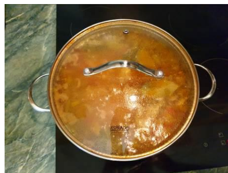
35. Накрываем кастрюлю крышкой и варим на малом огне