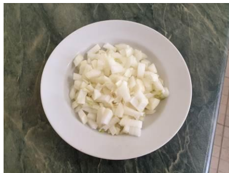
7. Режем лук репчатый мелко