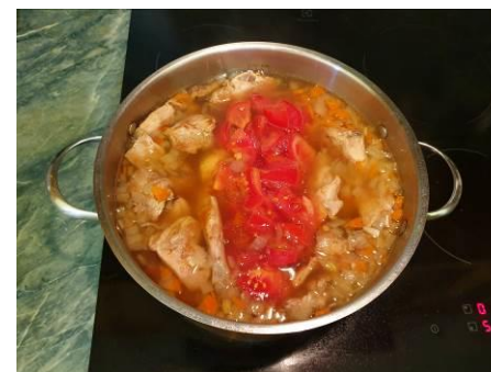
24. Кладём помидоры в кастрюлю