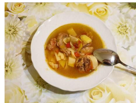
36. Подаём суп на стол