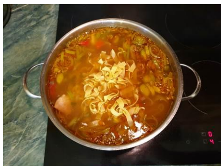
33. Кладём лапшу в кастрюлю