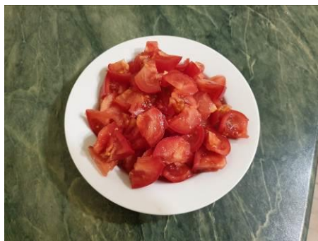
9. Режем помидоры мелко