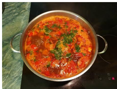
26. Кладём зелень кинзы в кастрюлю