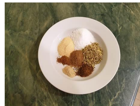
16. Отмеряем пропорции специй