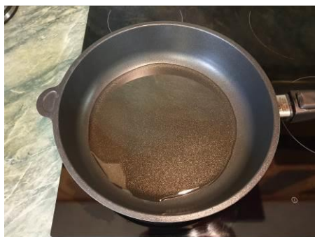
17. Ставим сковороду с маслом растительным на огонь