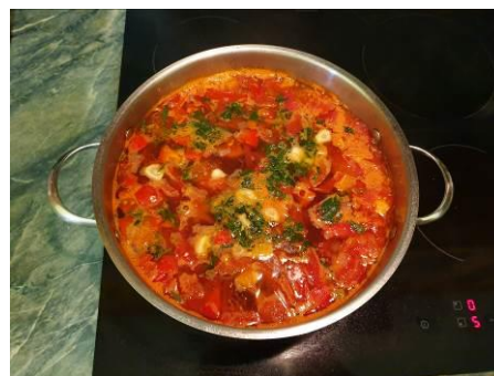
27. Кладём чеснок в кастрюлю