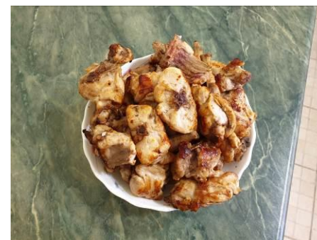
20. Обжаренное до румяной корочки мясо выкладываем на тарелку