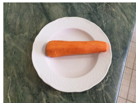
4. Чистим морковь