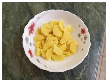
3. Чистим и режем картофель средними кусочками