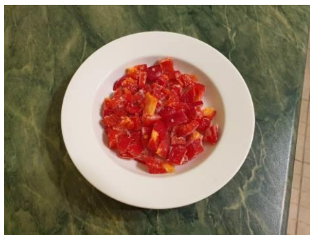
10. Размораживаем перец красный сладкий, нарезанный ср. кусочками