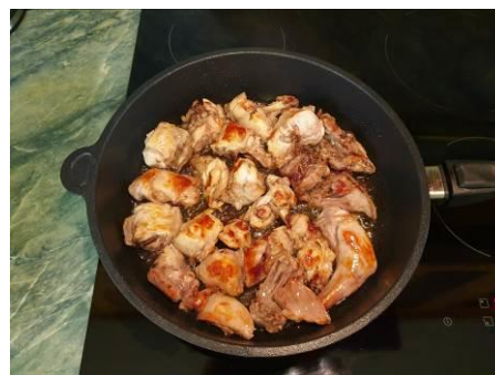
19. Периодически переворачиваем куски мяса кролика