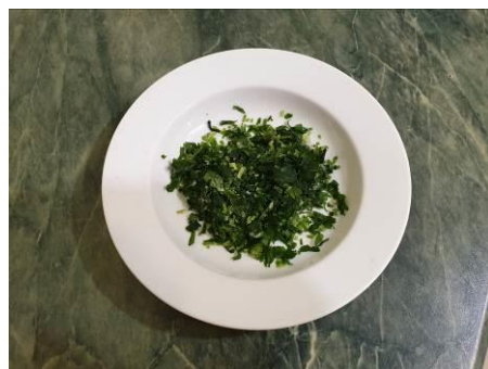
14. Нарезаем зелень кинзы