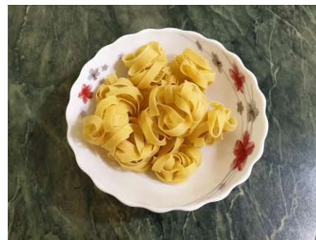
12. Отмеряем лапшу