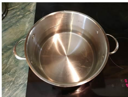
21. Ставим кастрюлю с водой на огонь