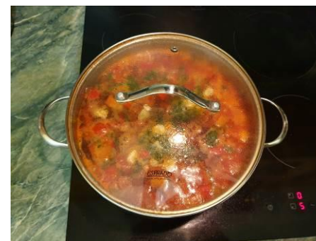
28. Накрываем кастрюлю крышкой и варим на малом огне