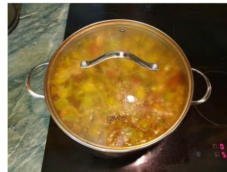
32. Накрываем кастрюлю крышкой и варим на малом огне