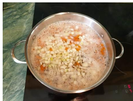
23. Кладём лук репчатый в кастрюлю