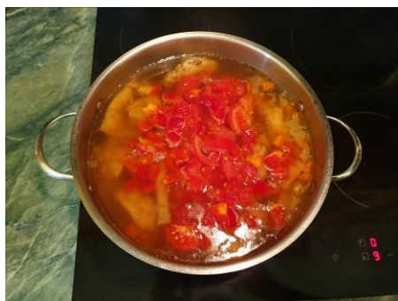
25. Кладём перец красный сладкий в кастрюлю