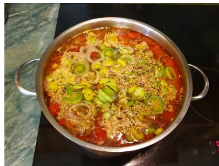
31. Кладём лук-порей в кастрюлю