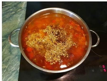
30. Кладём специи в кастрюлю