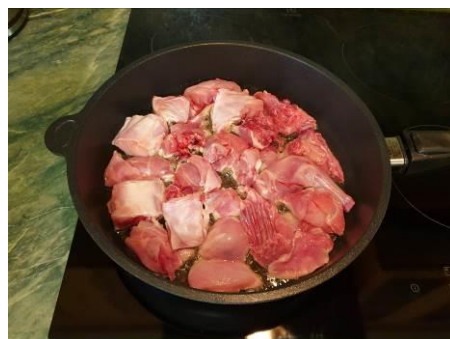
18. Кладём слой мяса кролика в сковороду, жарим в кипящем масле