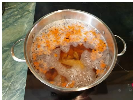
22. Кладём обжаренное мясо кролика и морковь в кастрюлю