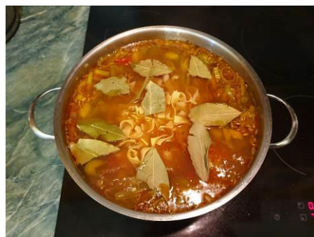
34. Кладём лист лавровый в кастрюлю