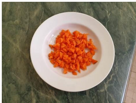
5. Режем морковь тонкими секторами