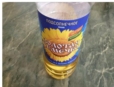
15. Берём масло растительное