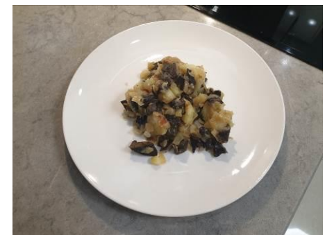
24. Подаём на стол