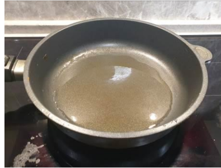
15. Наливаем масло растительное в сковороду