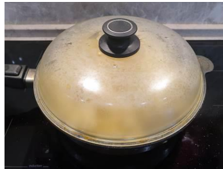
19. Накрываем сковороду крышкой, жарим на большом огне