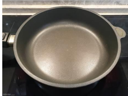
14. Ставим сковороду на огонь