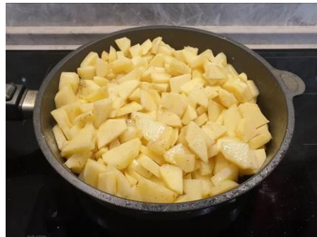
18. Перемешиваем содержимое сковороды, жарим на большом огне