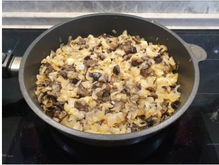
13. Перемешиваем, жарим на большом огне