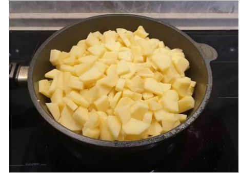
16. Кладём картофель в сковороду, жарим на большом огне