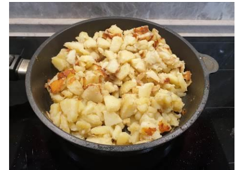
20. Перемешиваем картофель