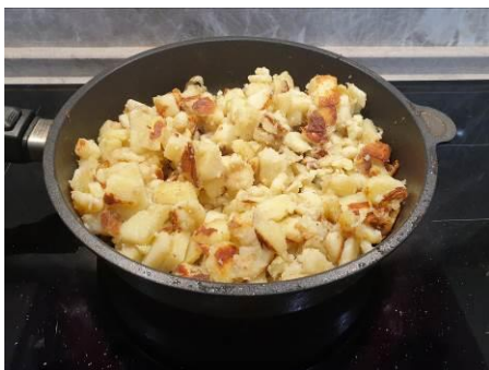
21. Жарим картофель до образования румяной корочки