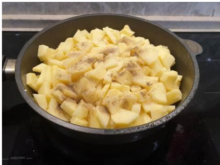
17. Кладём соль и перец чёрный молотый в сковороду