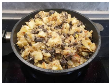
23. Перемешиваем, жарим на большом огне