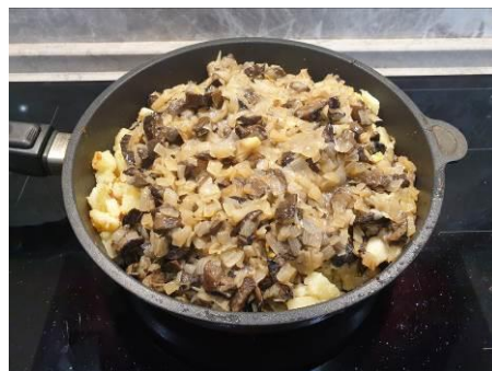
22. Кладём обжаренные лук и грибы в сковороду